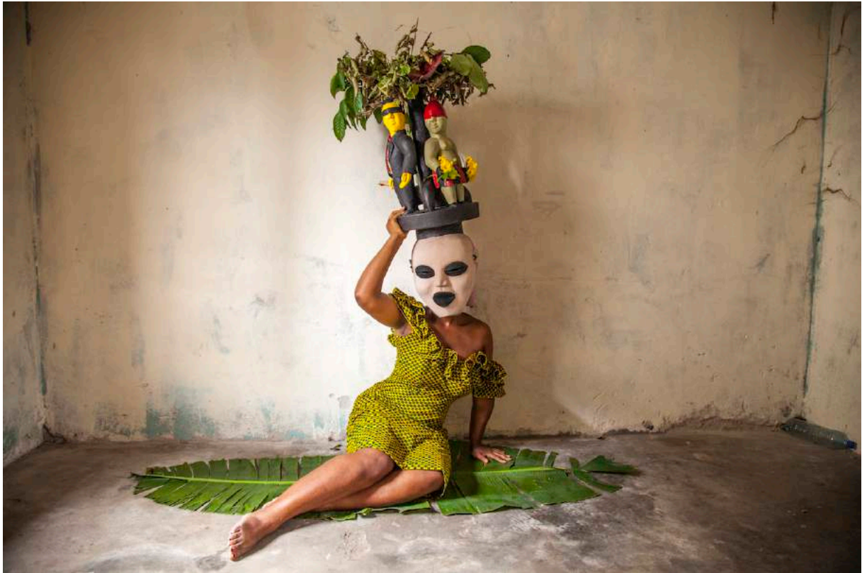
Zina Saro-Wiwa, The Invisible Man: The Weight of Absence , 2015. Extrait de la vidéo triptyque, 5'29''