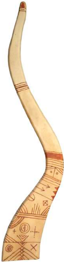
Farid Belkahia, Totem 1 , 1976. Teinture sur bois, 35 x 156,5 cm