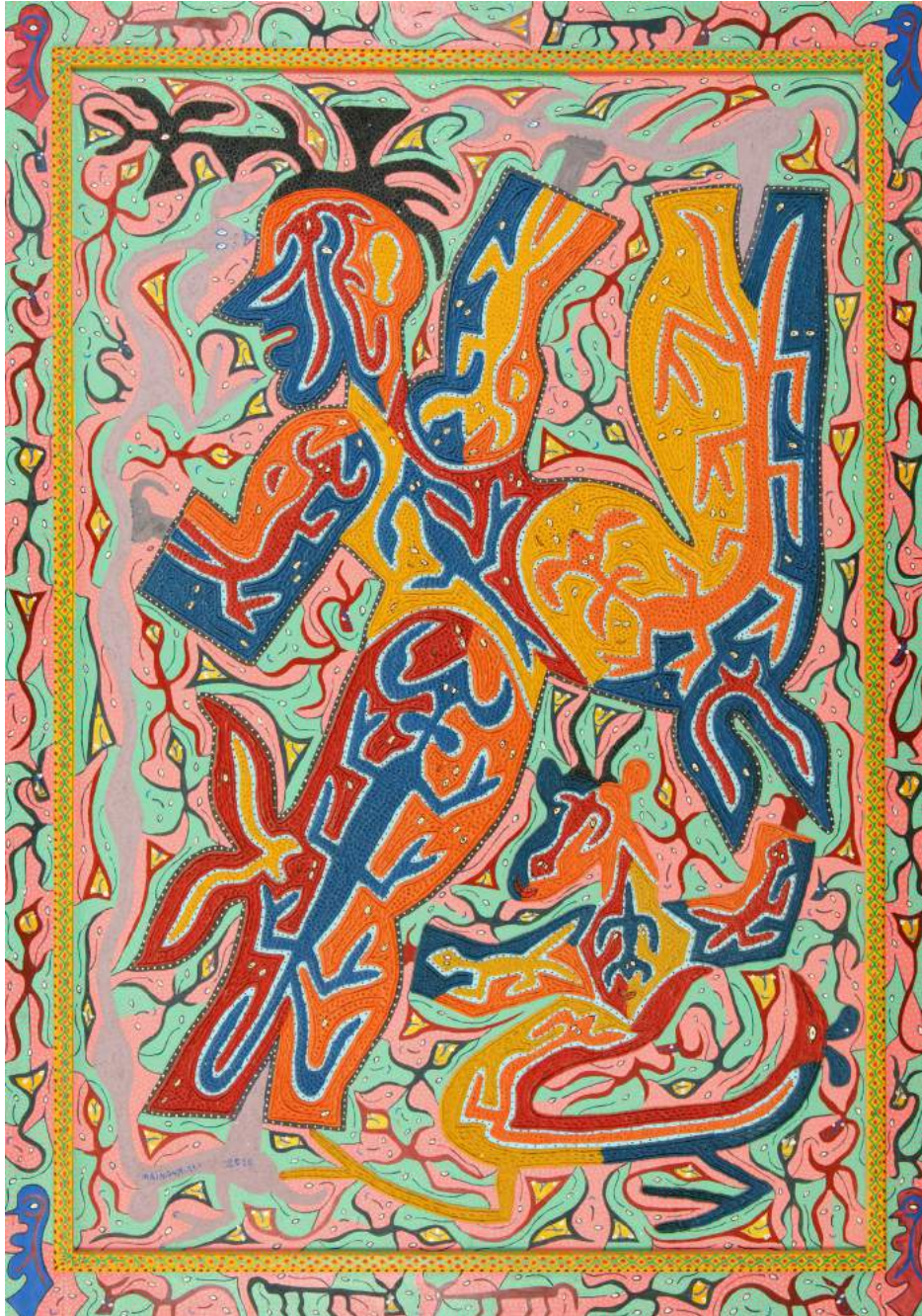
Ali Maimoun, Sans Titre Peinture sur panneau de bois, 200 x 140 cm © MACAAL

MUSEE D'ART CONTEMPORAIN AFRICAIN AL MAADEN MARRAKECH